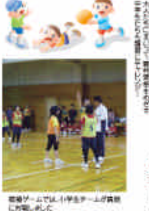
競技ゲームでは、小学生チームが優勝しました。