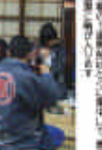
本郷Y地区の子ども会でも、お祭りに参加している。