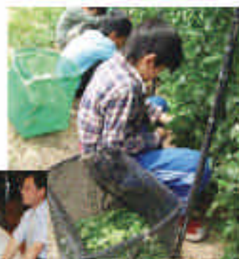
4年生は「お茶のついで」2日間の お茶摘み体験、4年生は「お茶のついで」 お茶摘み体験をしていました そして、お茶摘み体験をした後 お茶摘み体験の思い出を絵や作文 の形で発表します