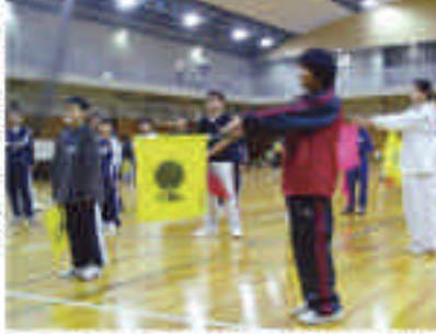
審判講習会では、審判の心得やルールを学びました。

審判講習会では、審判の心得やルールを学びました。子どもたちは、真剣な表情で講習会に参加しました。