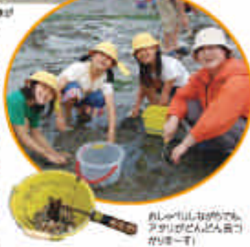
ビーチクリーン活動でもアサリとゆめ貝殻を交わしました。

お母さんたちも、お弁当を準備して下さいます。お弁当は、お母さんたちから持ってきてくれたお弁当です。