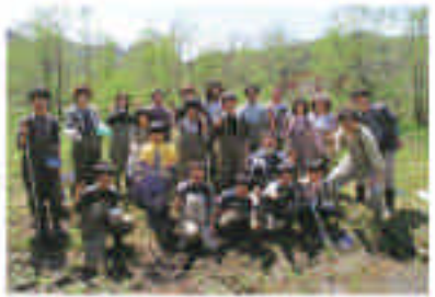
「トンボ大好き」では、池の水がもたせられた、三葉草科の葉が(牛山)や高松市のほか10以上のエコ活動で出かけています。

未来のために、今できることは何か？ いろんなことに興味を広げて、 小さな一歩を踏みだそう！