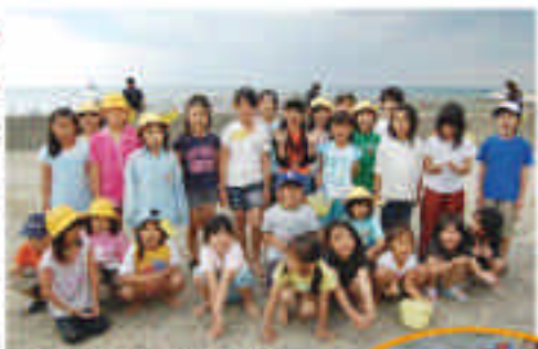
遠足先の一瀬町美浜町田北に足を伸ばしての遠足です。アサリとゆめ貝殻を交わしました。

夏休みには特別色紙の行事を企画していましたが、6月19日に行ったのは、一瀬町の美浜町田北に足を伸ばしての遠足です。道の善口に置かれたアサリとゆめ貝殻を交わしました。「アサリは白アサリがたくさんおれたよ。」と嬉しそうに話していました。お弁当は、お母さんたちから持ってきてくれたお弁当です。